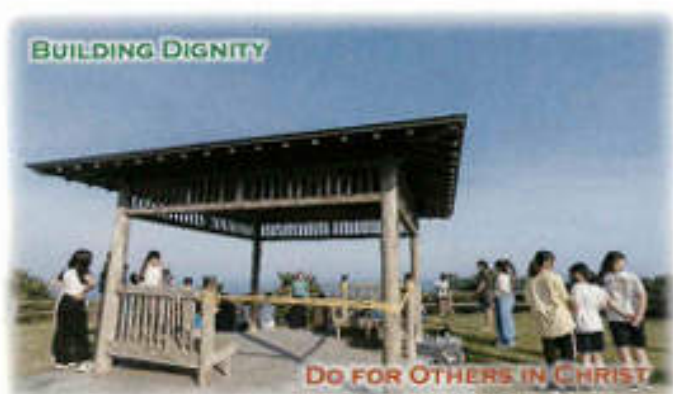
7/7 太平洋を見下ろす勝浦の官軍塚でお弁当&amp;夕礼拝

小学5年生の時に父が、論語の本を買ってきてくれて、これを読んだらいいよと勧めてくれました。漢字だらけでしたが、日本語での解説もついていて、意味を説明してもらいながらそれを読んでいる内に何となく漢詩や古典というものにも興味を持つようになっていきました。三育高校時代は理系進学に備えるつもりで科目選択をしていましたので、古文漢文の授業は履修できないという事が分かりました。そこで、担当の先生